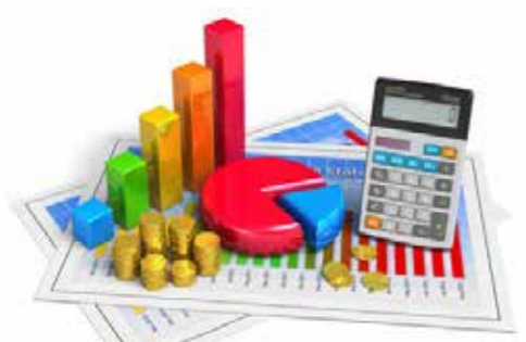
DOSSIER SPÉCIAL Le budget 2025 de la commune