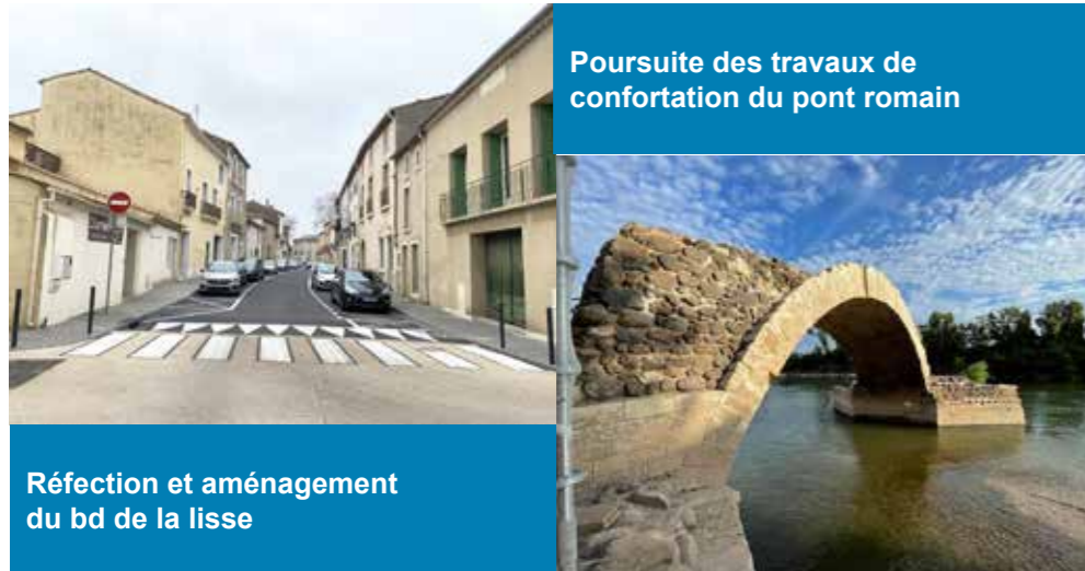
Poursuite des travaux de confortation du pont romain