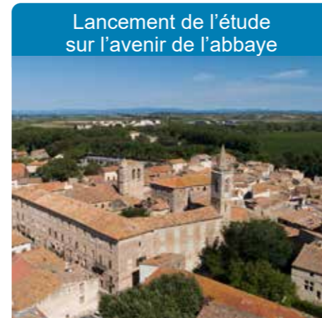
Lancement de l'étude sur l'avenir de l'abbaye