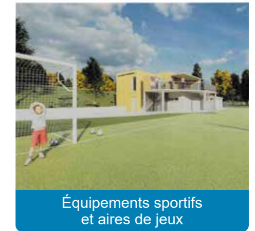
Équipements sportifs et aires de jeux