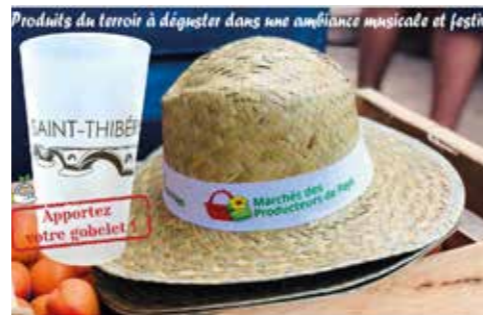
AGENDA DES FESTIVITÉS DE L'ÉTÉ Toutes les dates en dernière page