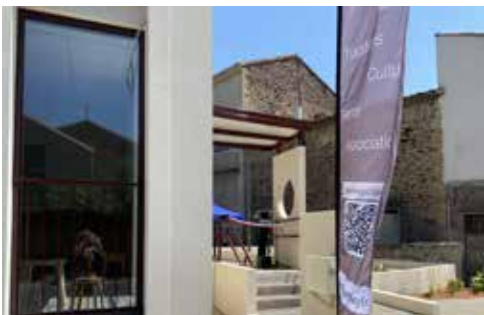
MAISON MÉDICALE Retour sur l'inauguration du 21 juin